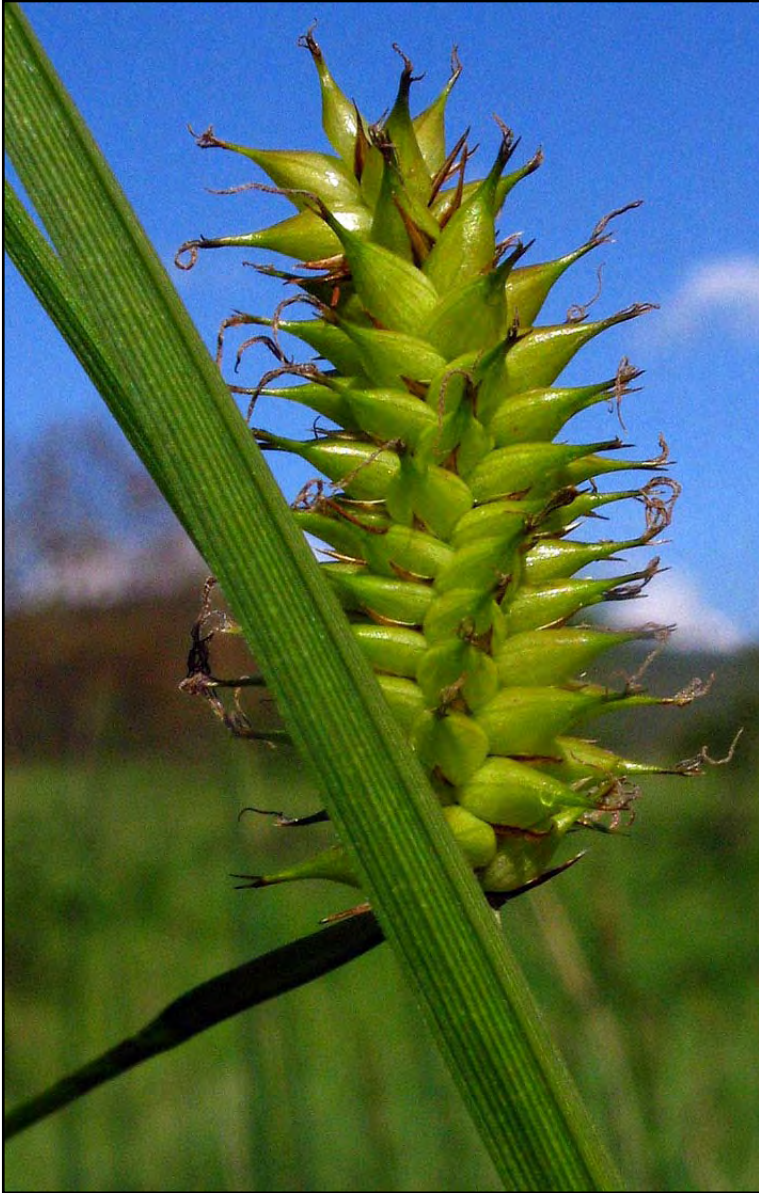
Figura 2. Carex vesicaria , fotografiada en Villa Juanita en mayo de 2006.