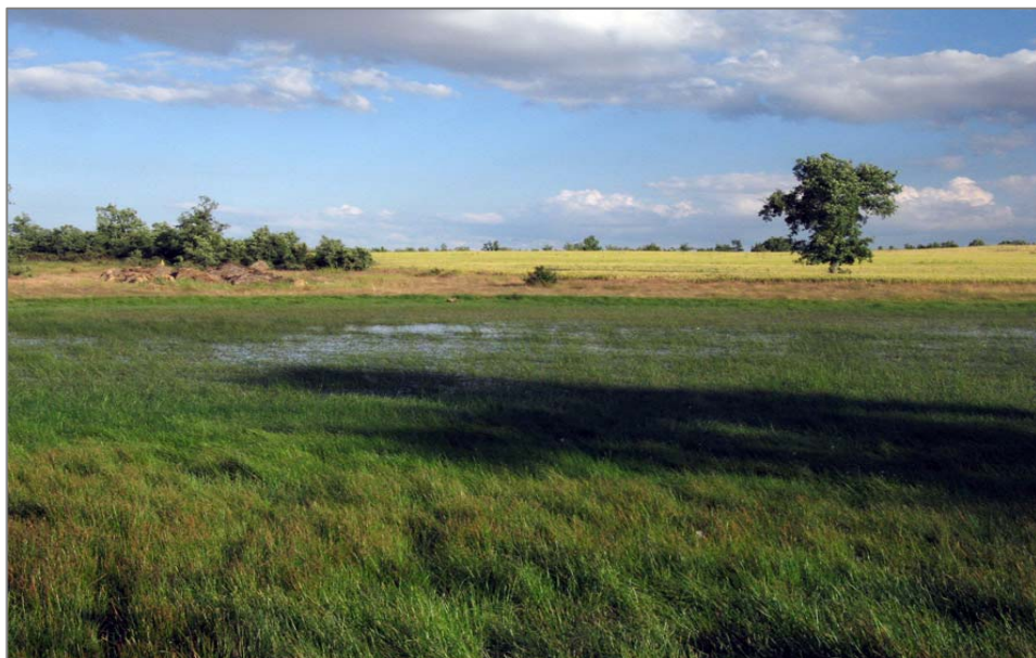
Figura 4. Rabanera del Campo, laguna del Ciego