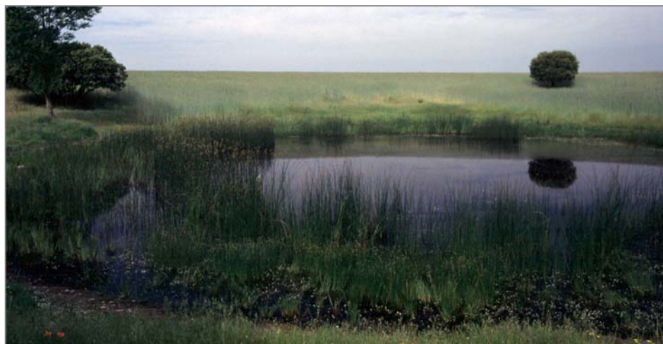
Figura 5. Tardajos de Duero, laguna de Blasco Nuño