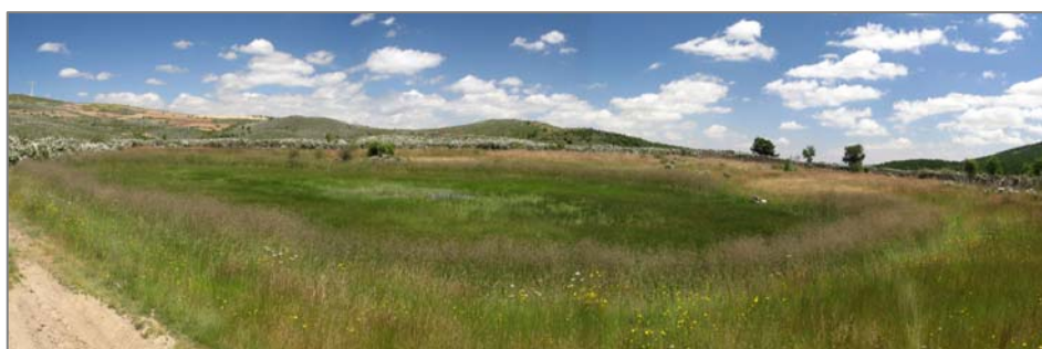
Figura 7. Suellacabras, Laguna El Espino