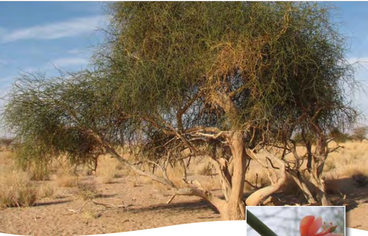
Capparis decidua (Forssk.) Edgew. ■