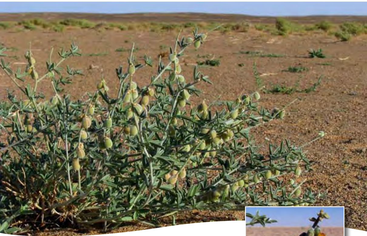
Crotalaria sabarae Coss. ■