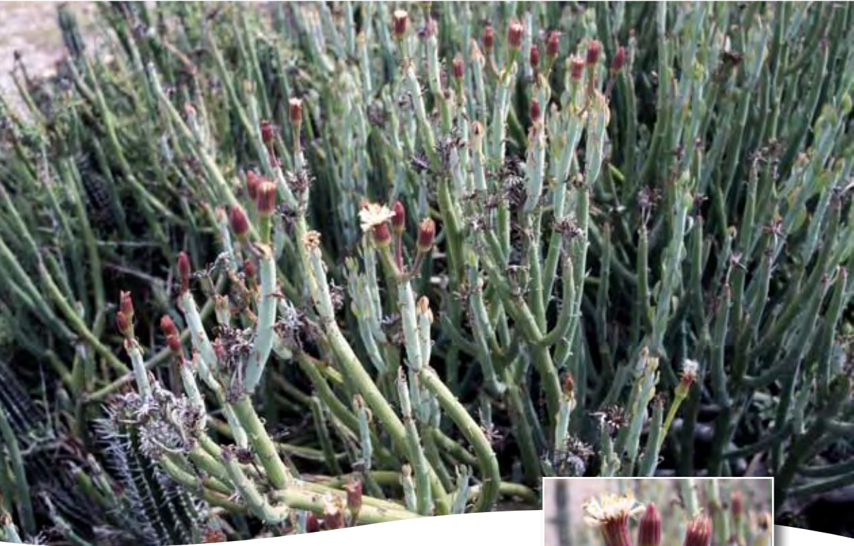
Senecio anteuphorbium (L.) Hook. fil. ■