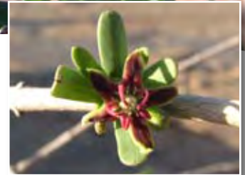
Periploca angustifolia Labill. ■ (= P. laevigata auct. et collet. non Aiton)