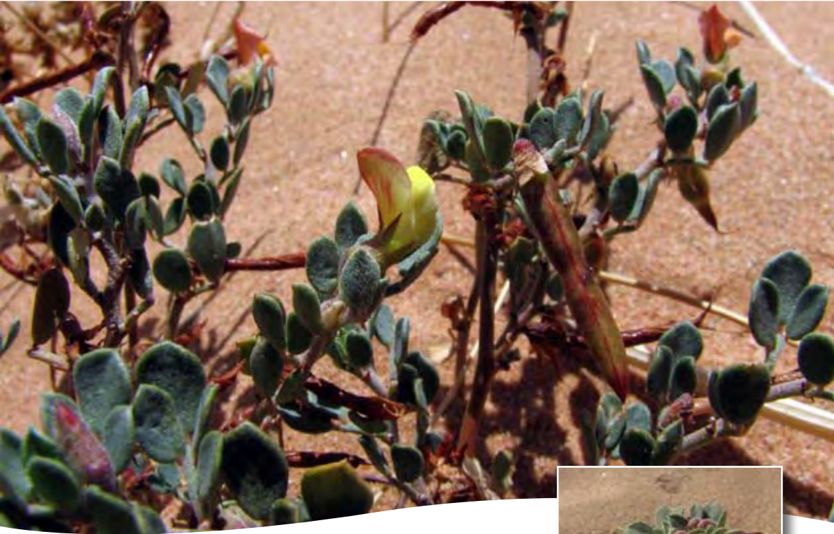
Lotus roudarei Bonnet ■