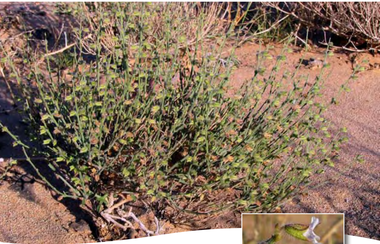
Salvia aegyptiaca L. ■