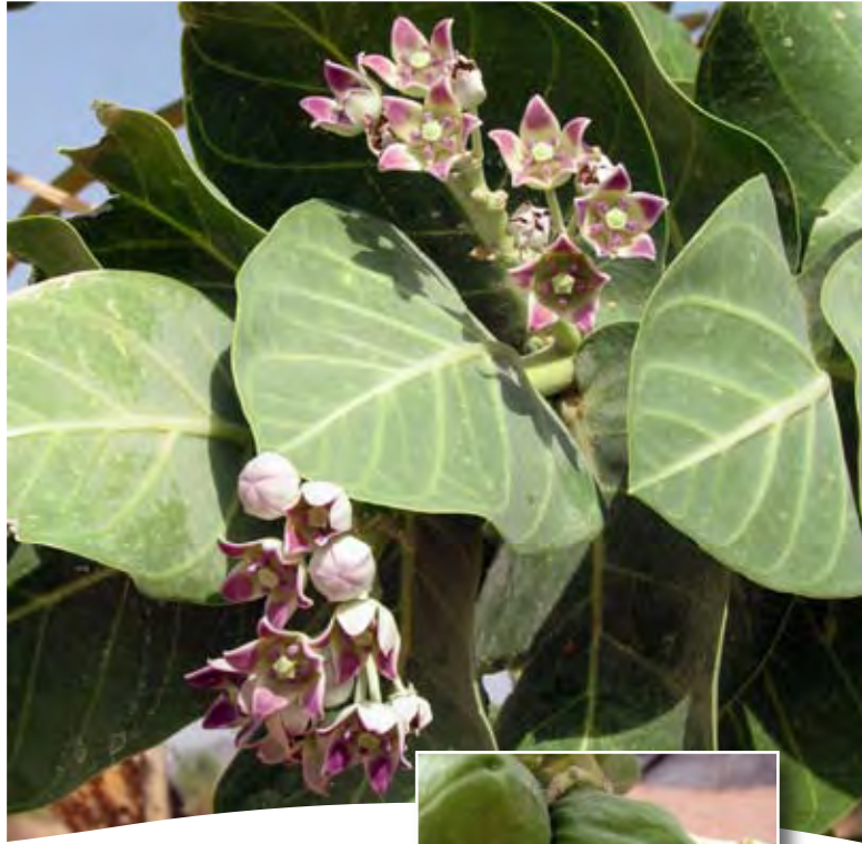
Calotropis procera (Ait.) Ait. f. ■ subsp. procera