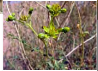
Ruta tuberculata Forsk. ■ (= Haplophyllum tuberculatum Juss.)