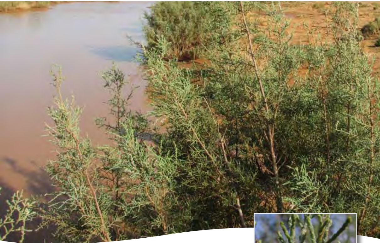
Tamarix gallica s.l. ■