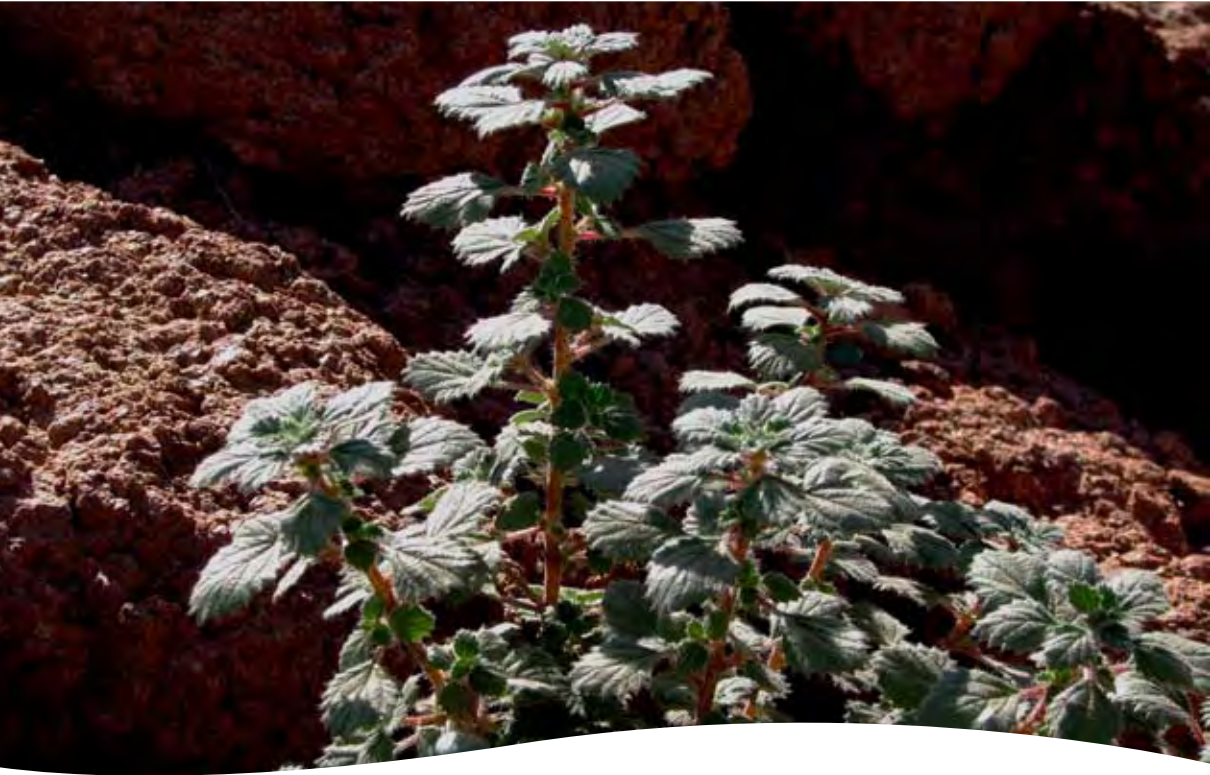
Forsskalea tenacissima L. ■