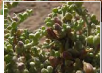
Zygophyllum gaetulum ■ subsp. waterlotii (Maire) Dobignard