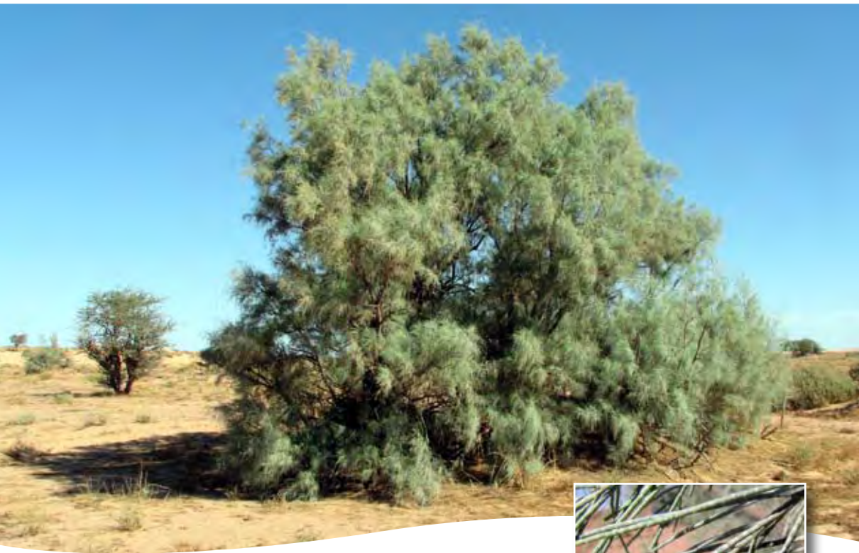
Tamarix aphylla (L.) H. Karst. ■