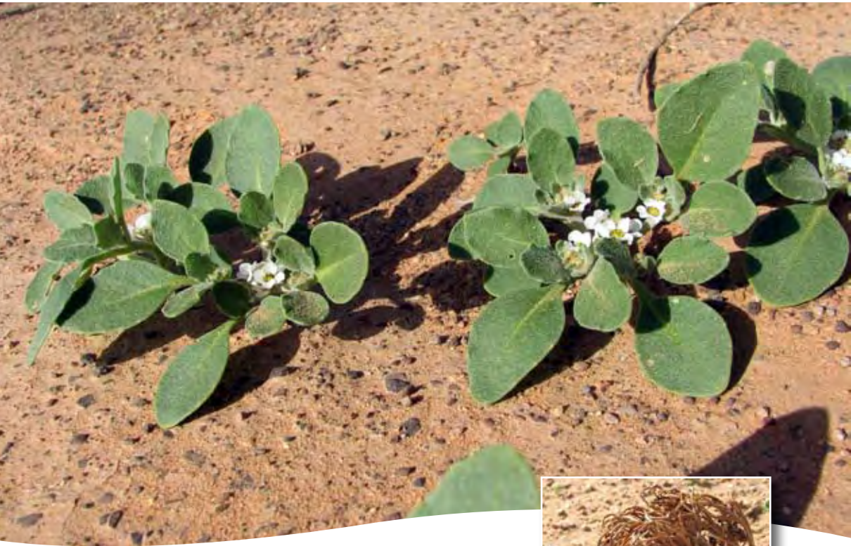
Anastatica hierochuntica L. ■