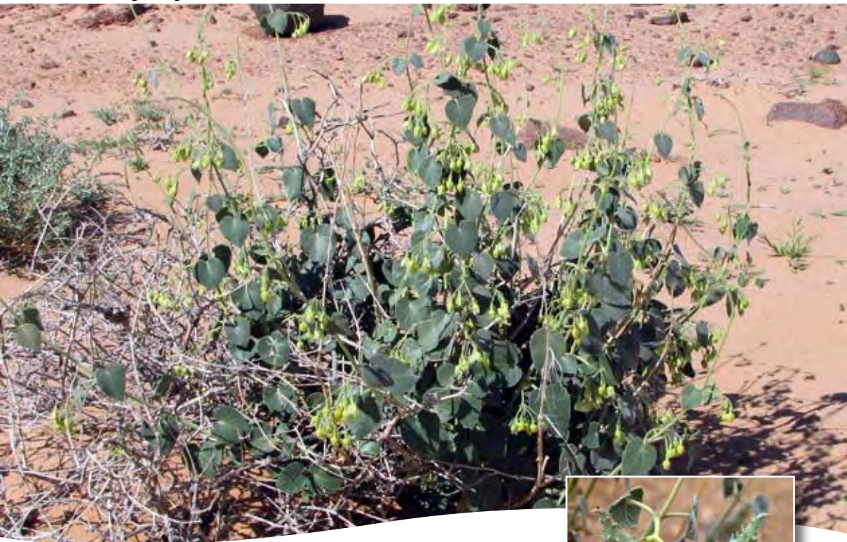
Pergularia tomentosa L. ■