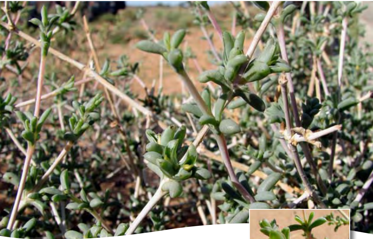
Nucularia perrini Batt. ■