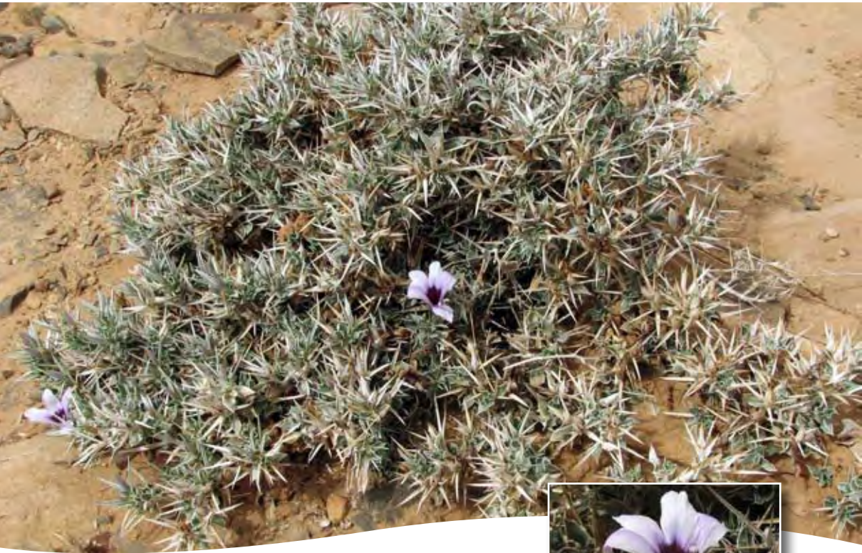
Barleria schmittii Benoist ■