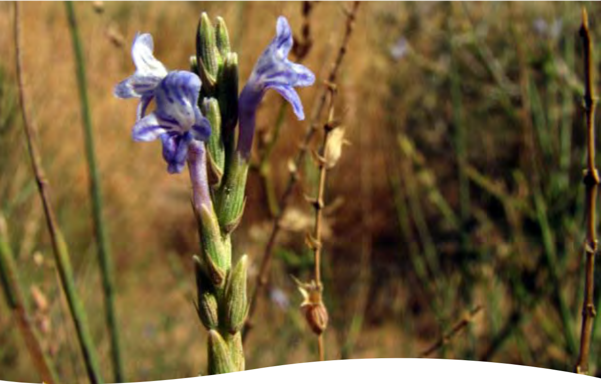
Lavandula coronopifolia Poiret ■