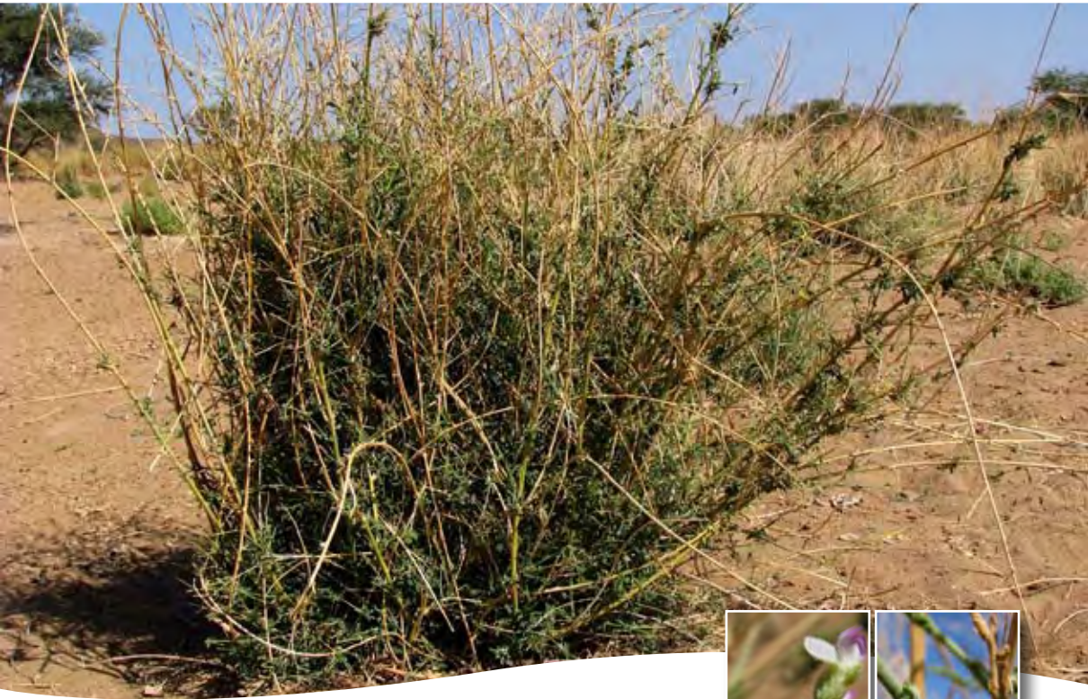
Psoralea plicata Del. ■