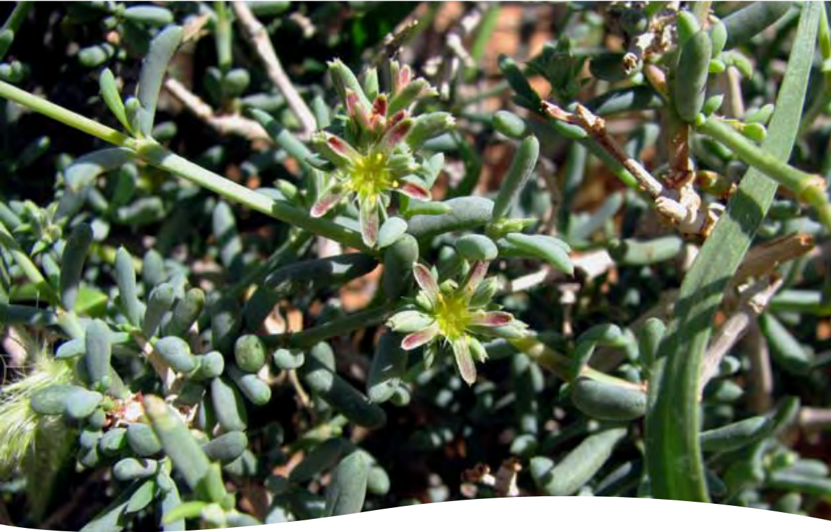
Gymnocarpus decandrus Forssk. ■