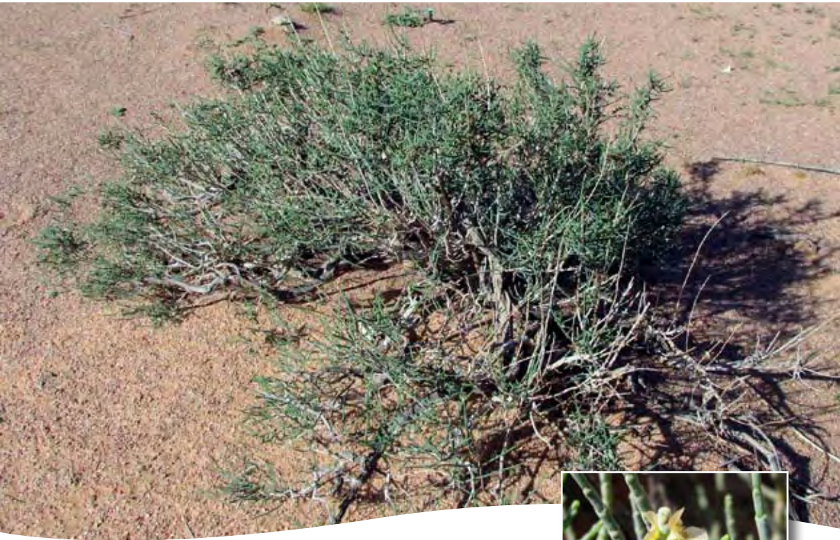
Hammada scoparia (Pomel) Iljin ■ (= Haloxylon tamariscifolium (L.) Pau)