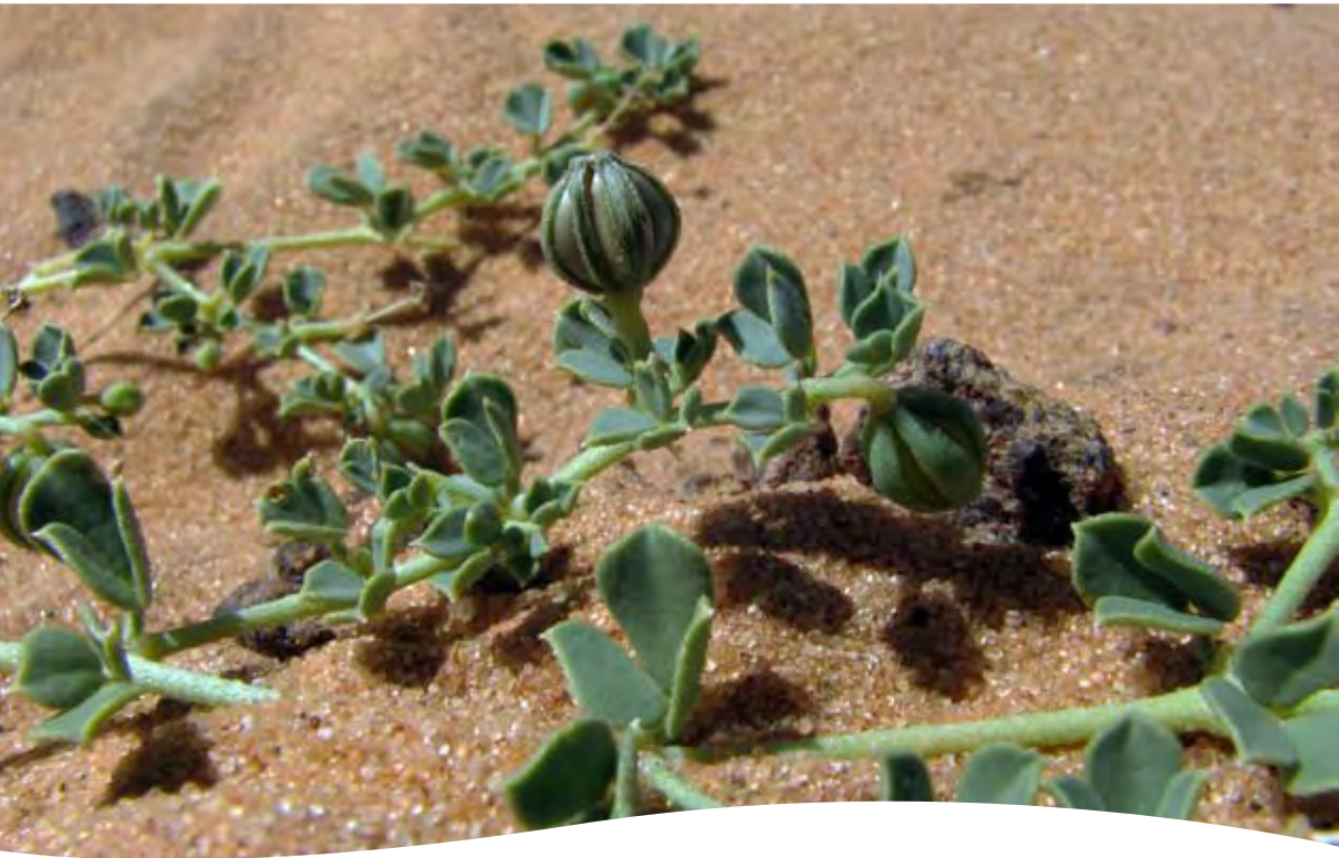
Seetzenia lanata (Willd.) Bull. (= S. africana R. Br.) ■