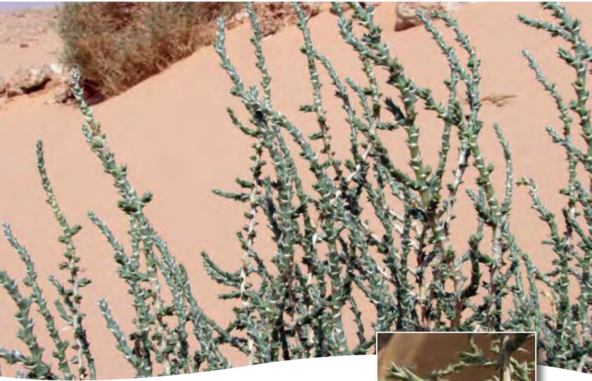
Cornulaca monacantha Del. ■