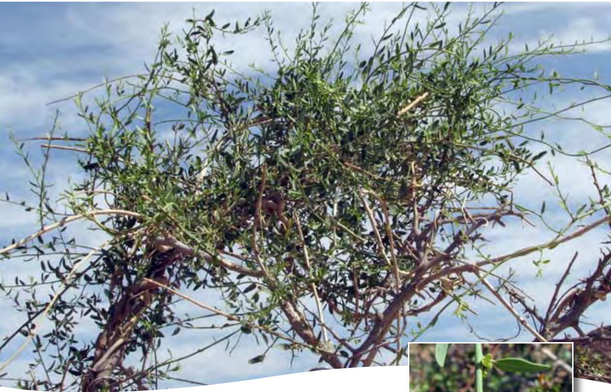
Cocculus pendulus (J. R. & G. Forst.) Diels ■