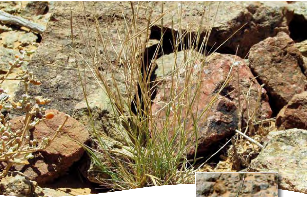
Dichantium foveolatum (Del.) Roberty ■ (= Andropogon foveolatus Del.)