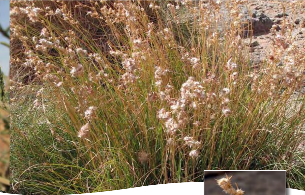
Andropogon laniger Desf. ■