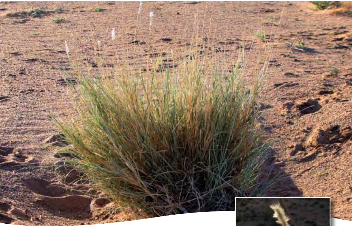
Lasiurus scindicus Henrard ■ (= L. hirsutus (Vahl) Boiss.)