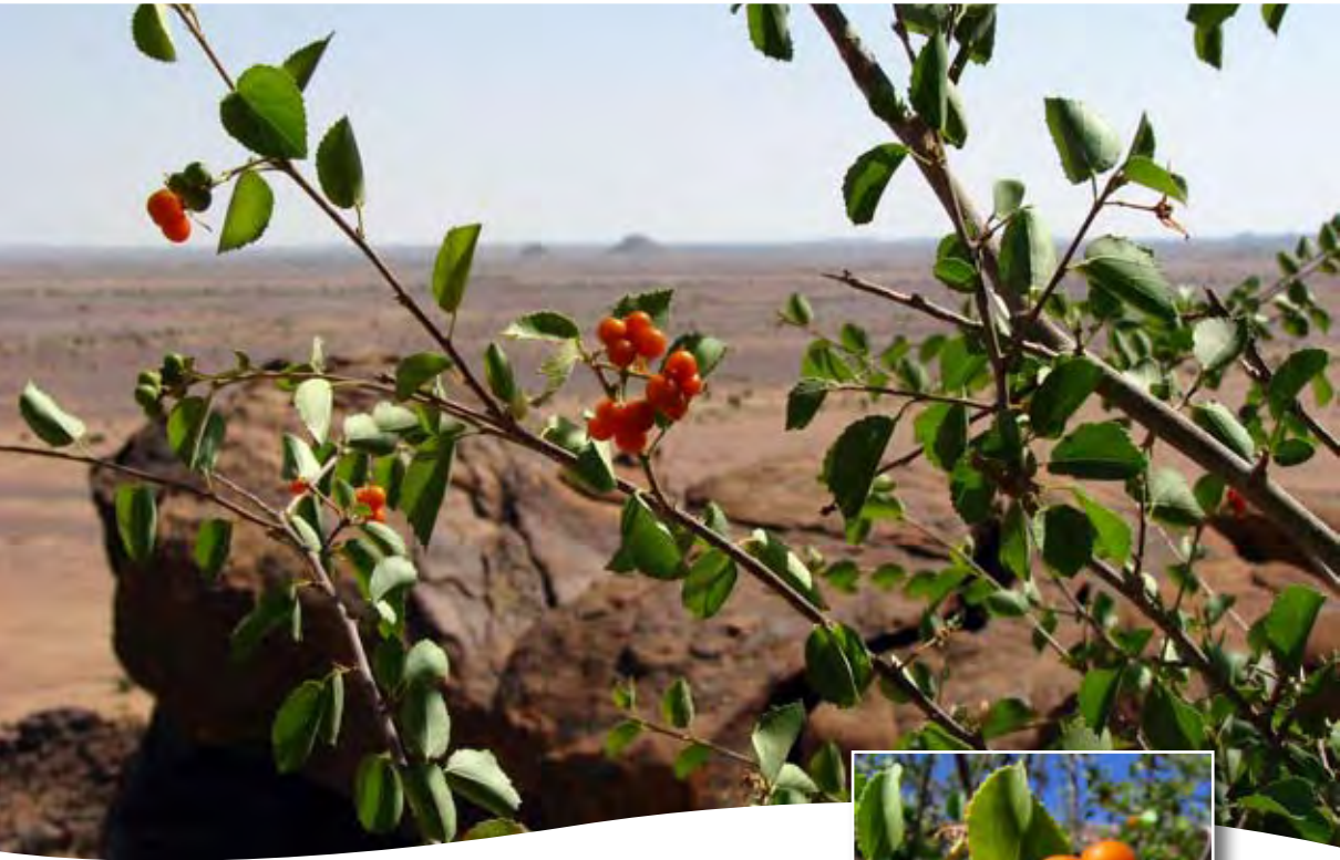
Grewia tenax (Forssk.) Fiori ■