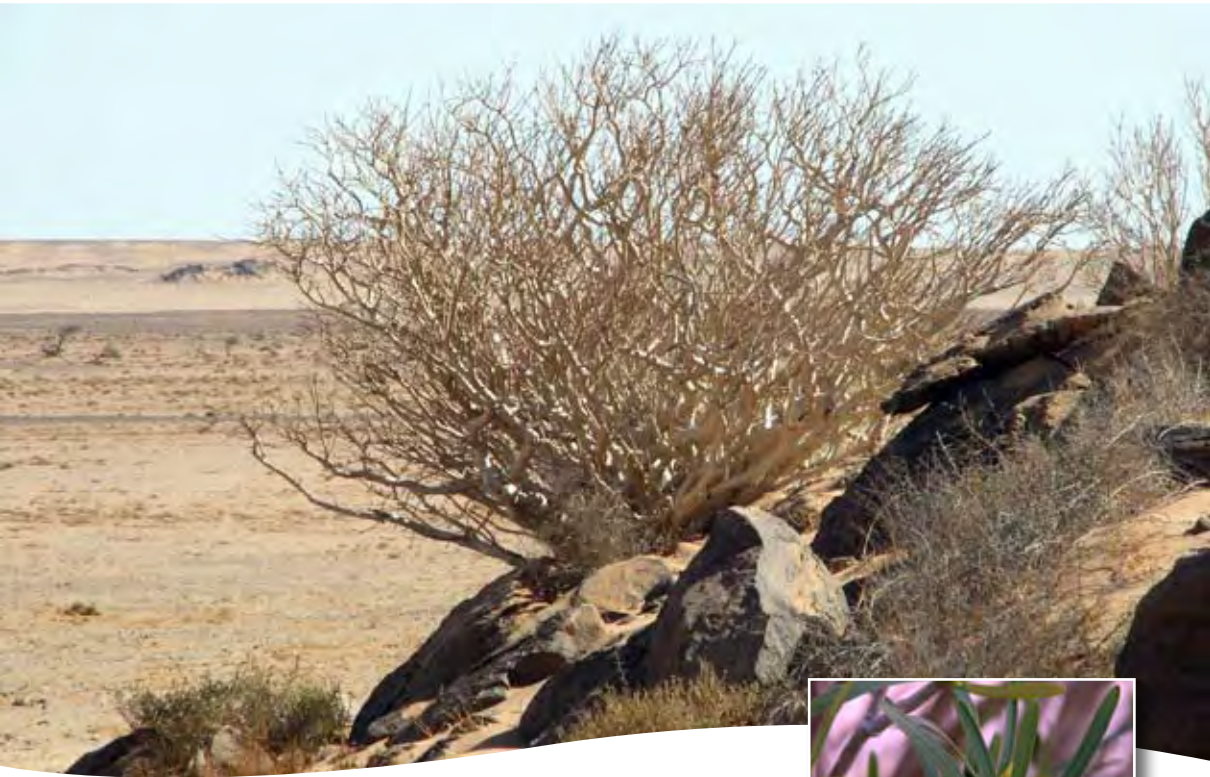
Euphorbia balsamifera Aiton ■