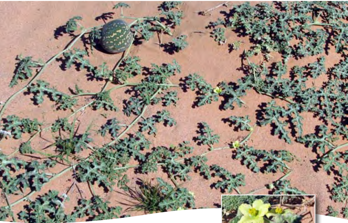
Citrullus colocynthis (L.) Schrad. ■