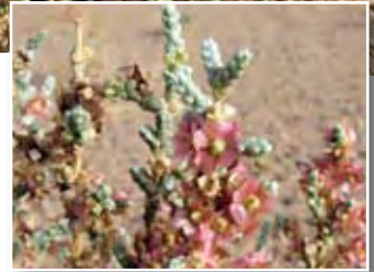
Salsola tetragona Del. ■