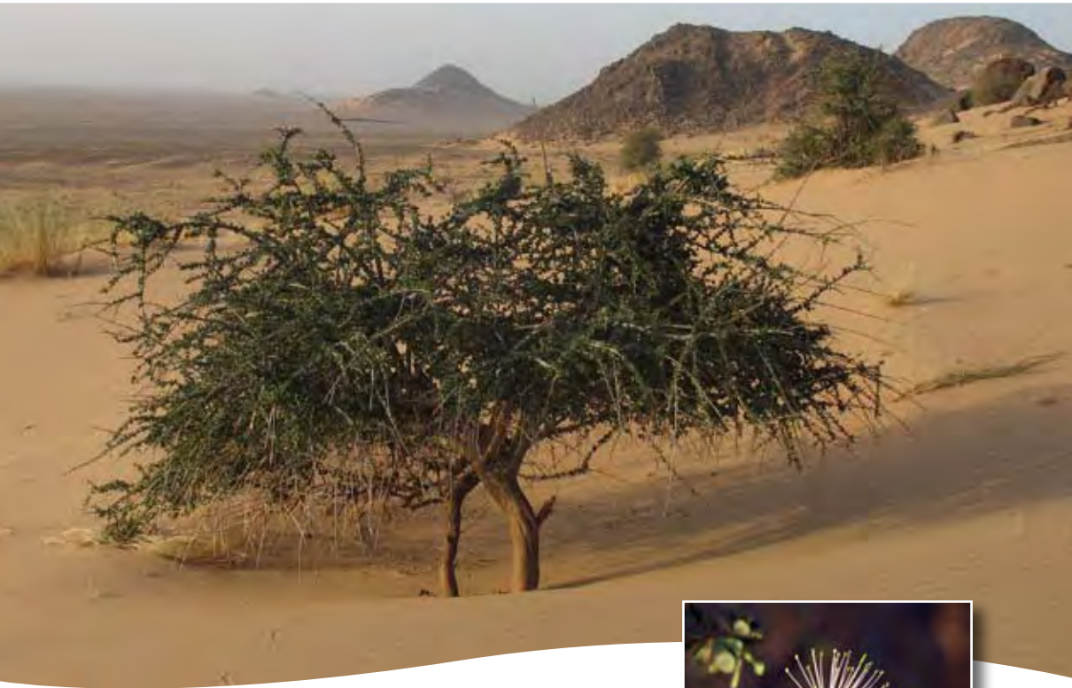
Maerua crassifolia Forssk. ■