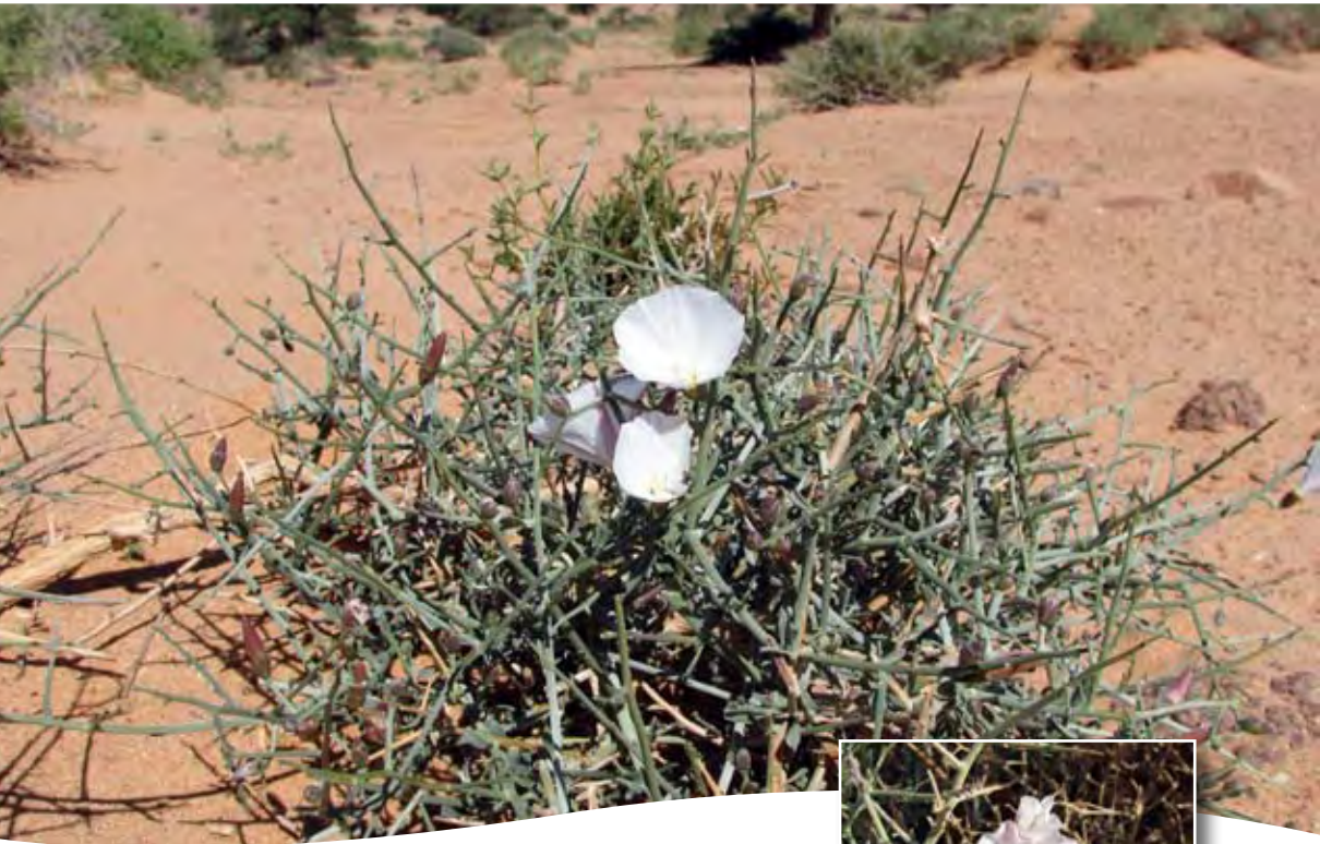
Convolvulus trabutianus Schw. et Musch. ■