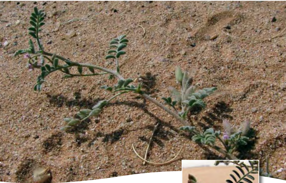
Astragalus vogelii (Webb) Bornm. ■