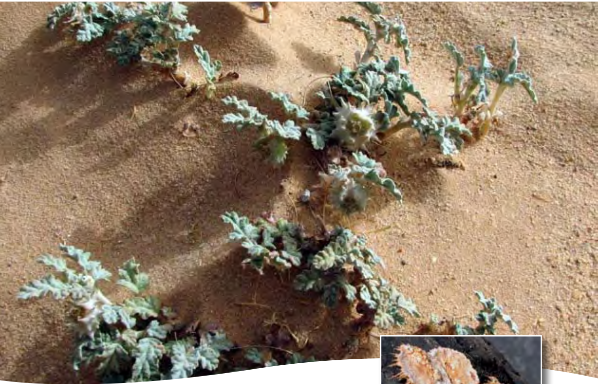
Neurada procumbens L. ■