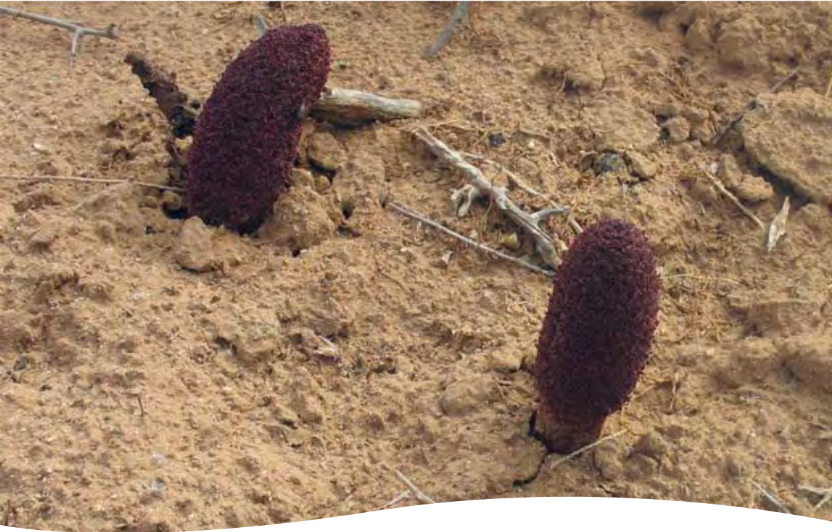
Cynomorium coccineum L. ■