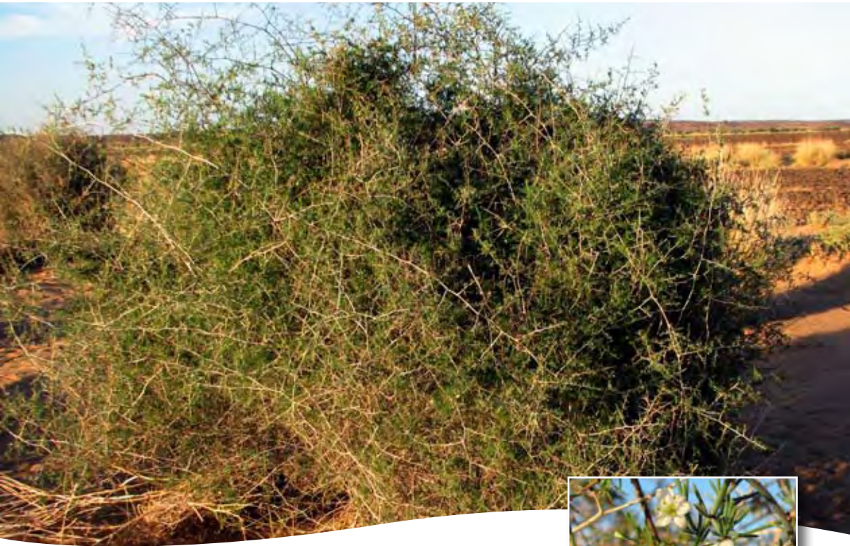
Asparagus altissimus Munby ■