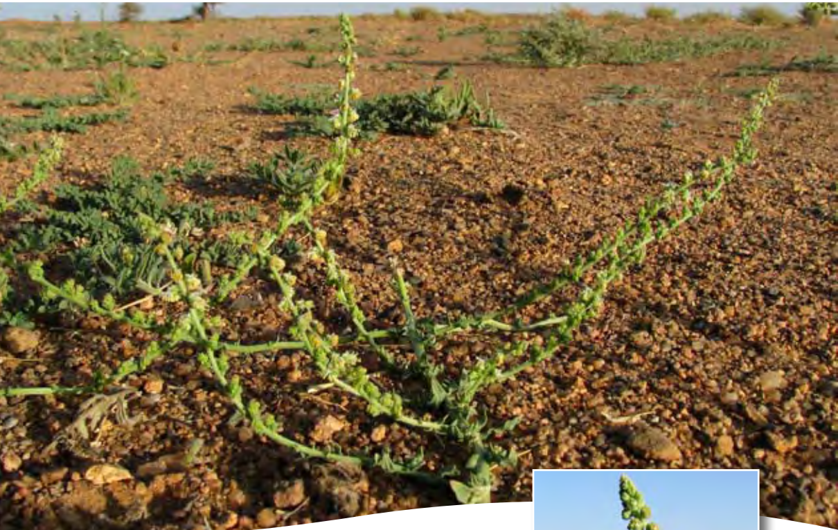
Caylusea hexagyna (Forssk.) M.L. Green ■