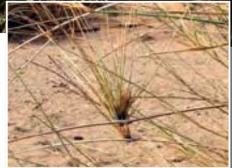
Panicum turgidum Forssk. ■