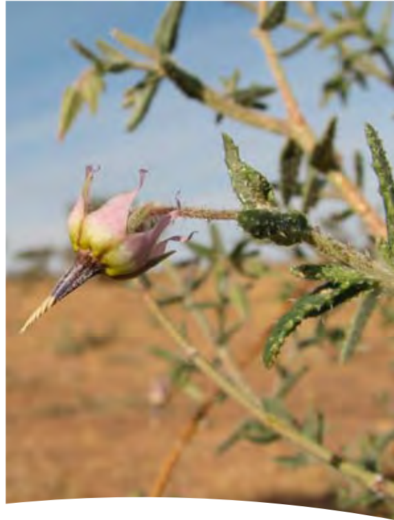
Echium horridum Batt. ■ Trichodesma calcaratum Coss.