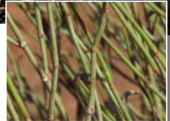
Ephedra alata Decne. ■