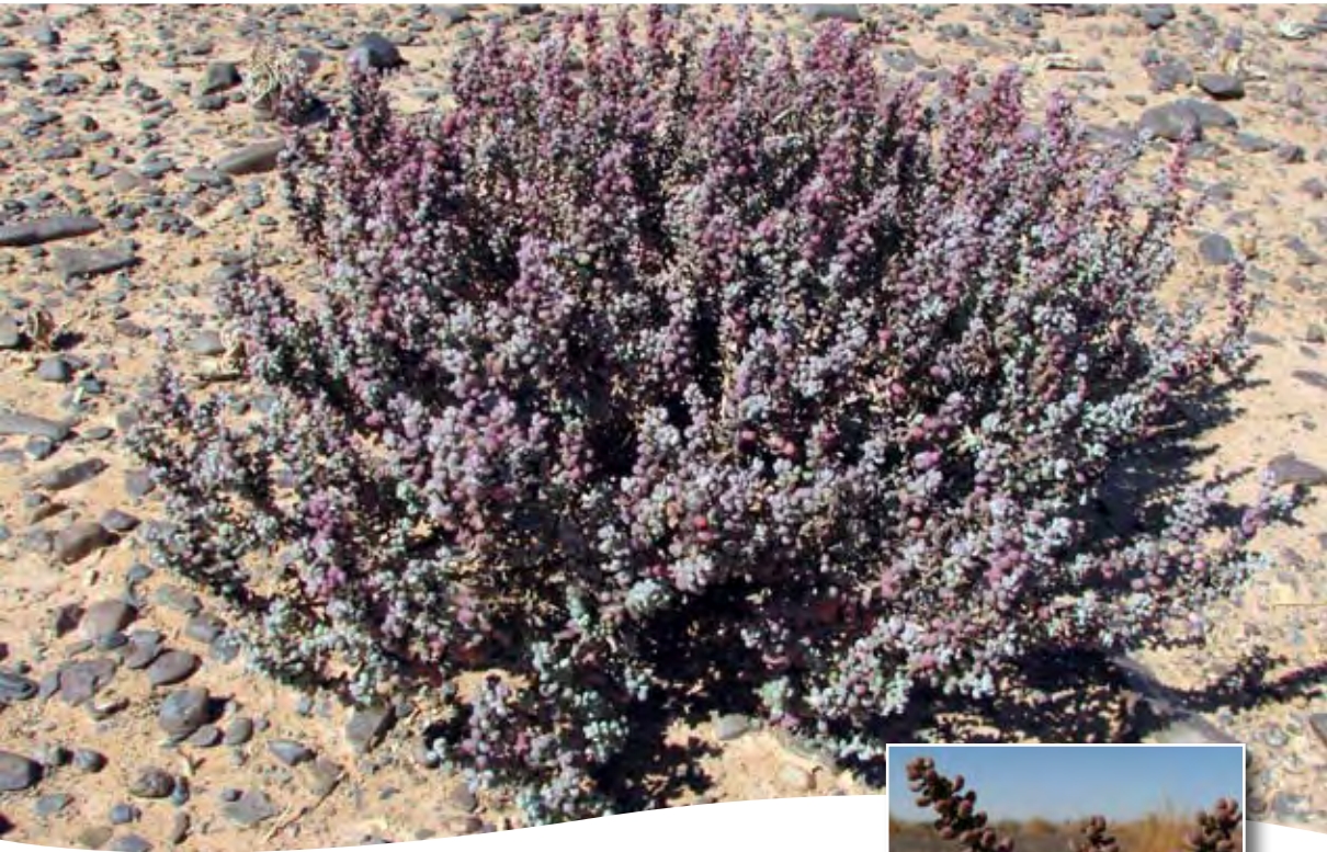
Suaeda vermiculata Forssk. ■