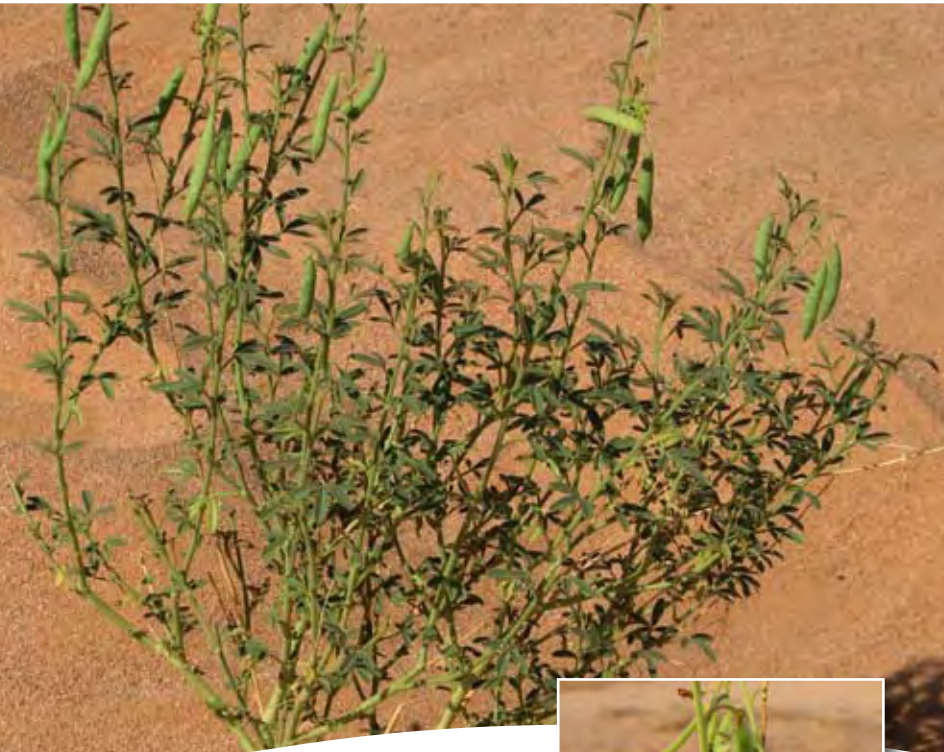
Cleome arabica L. ■