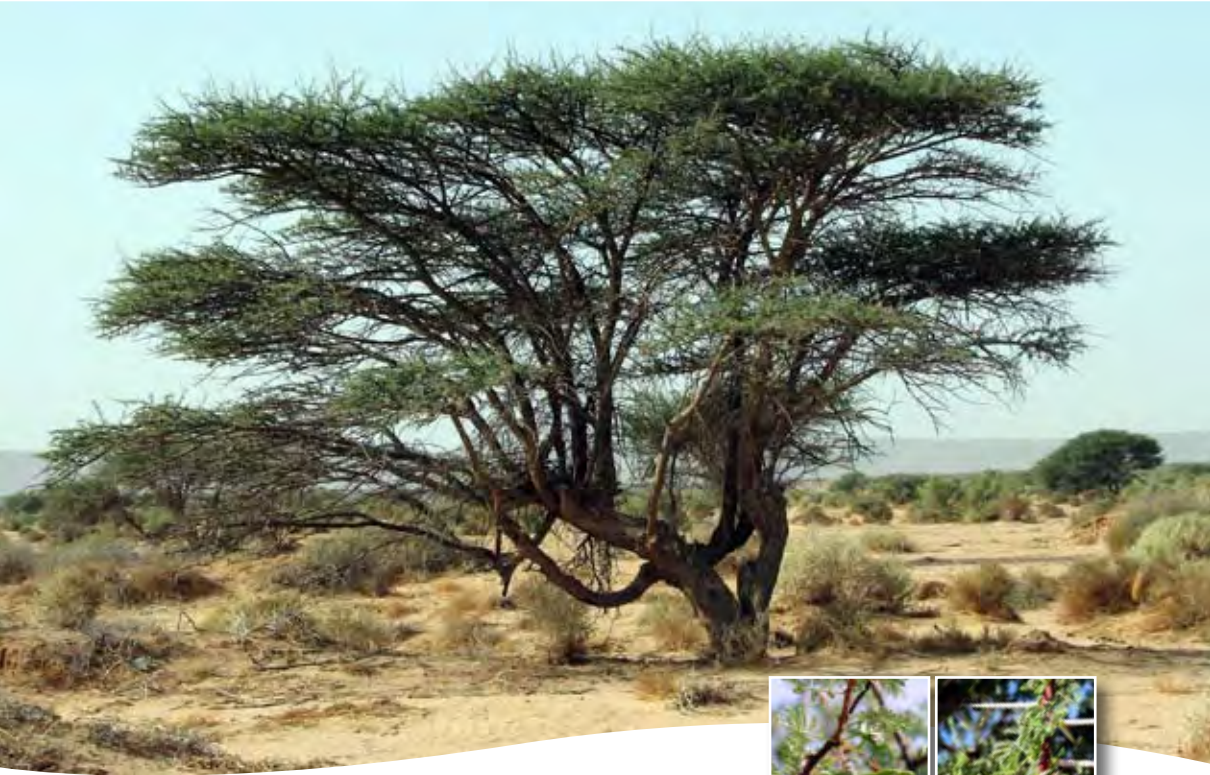
Acacia tortilis ■ subsp. raddiana (Savi) Brenan.