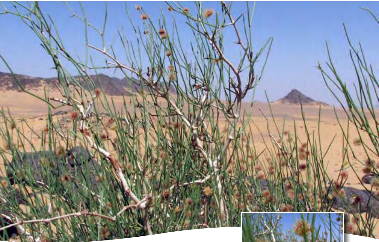
Calligonum comosum L'Hér. ■