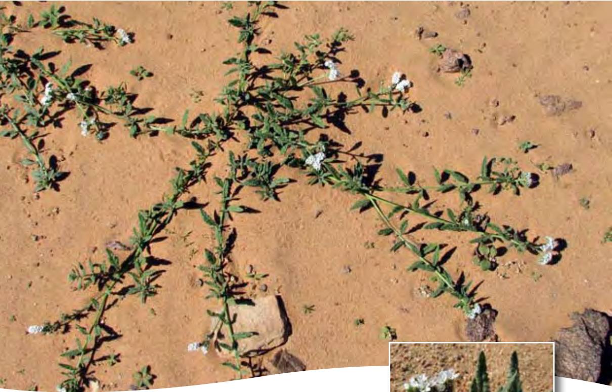
Heliotropium ramosissimum (Lehm.) DC. ■