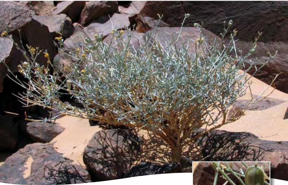
Farsetia aegyptia Turra ■