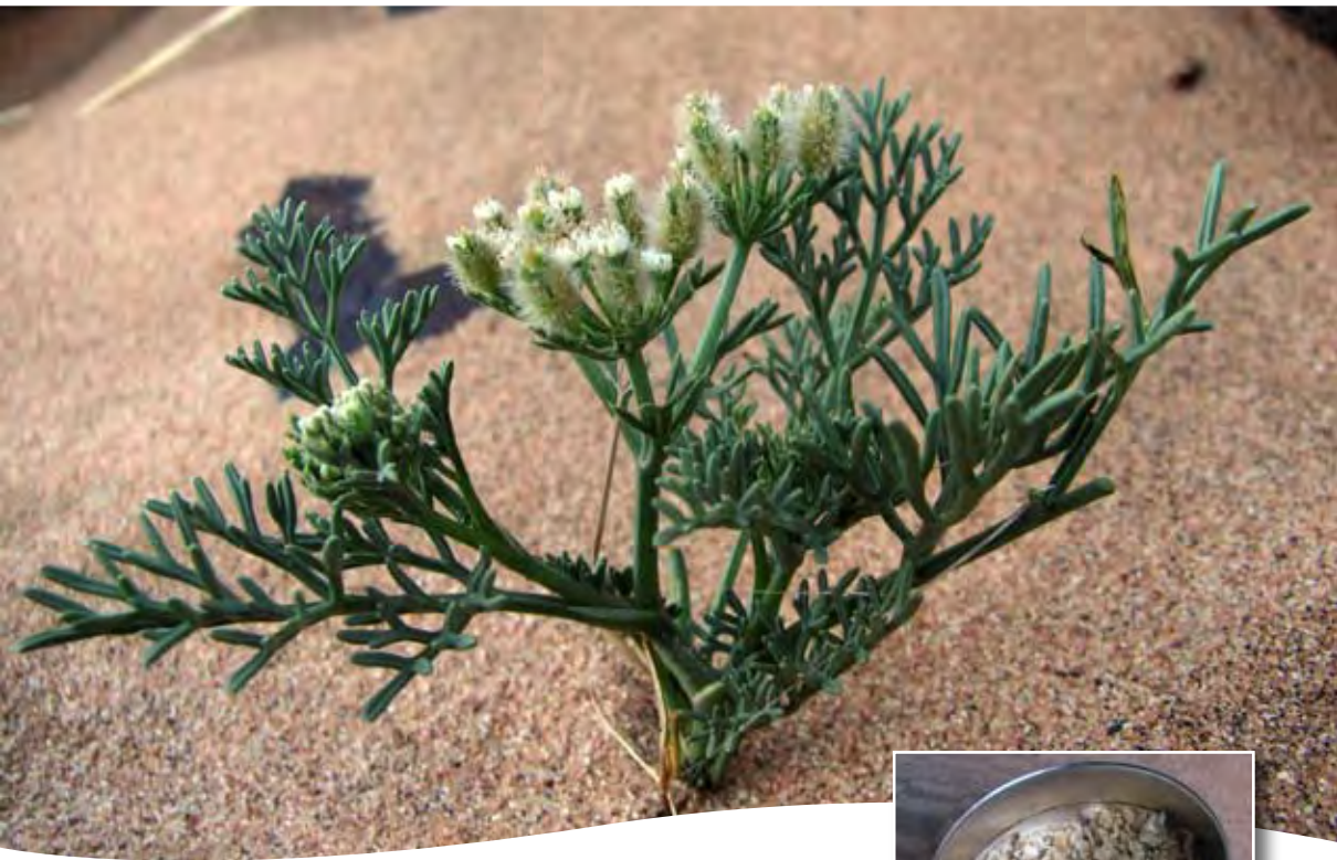
Ammodaucus leucotrichus Coss. & Dur. ■