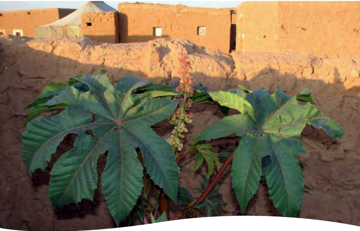
Ricinus communis L. ■