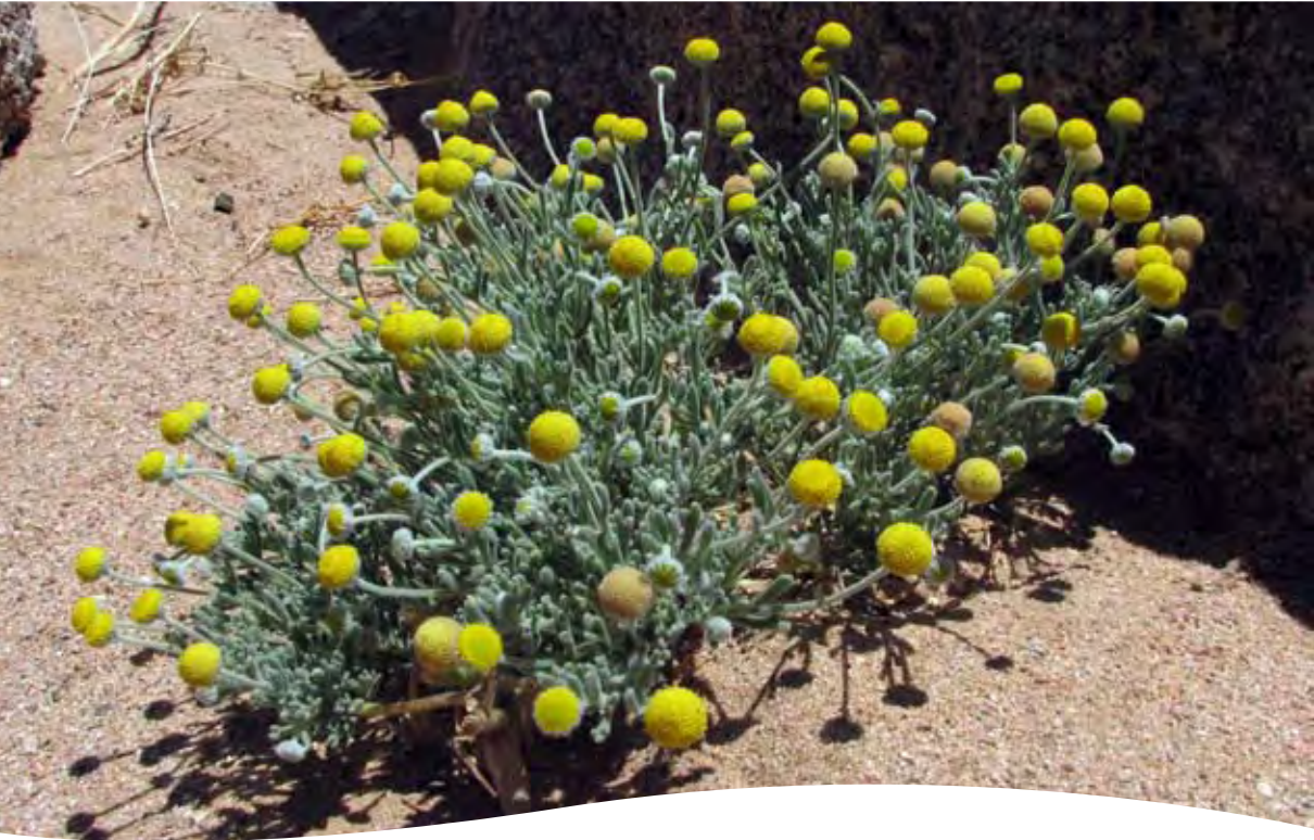
Cotula cinerea Del. ■ (= Brocchia cinerea (Del.) Vis.)