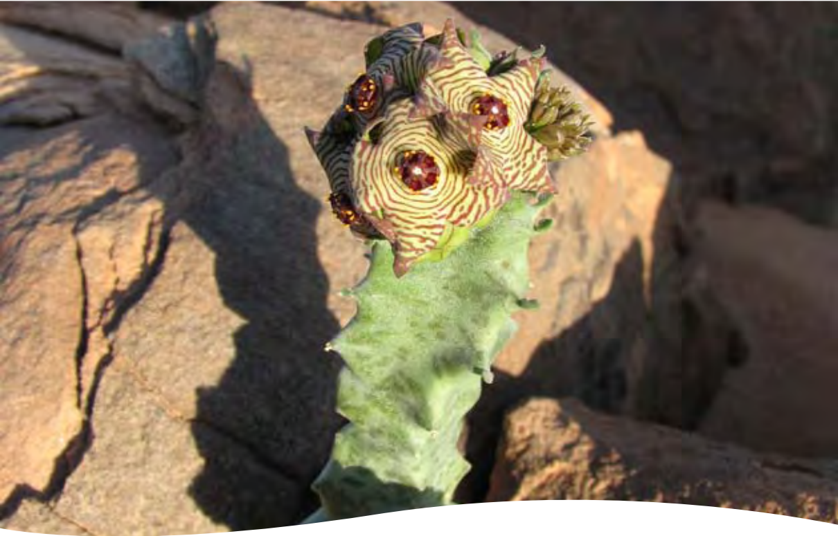
Caralluma sp. ■