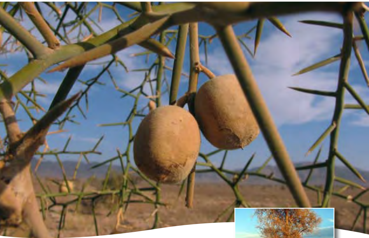
Balanites aegyptiaca (L.) Del. ■