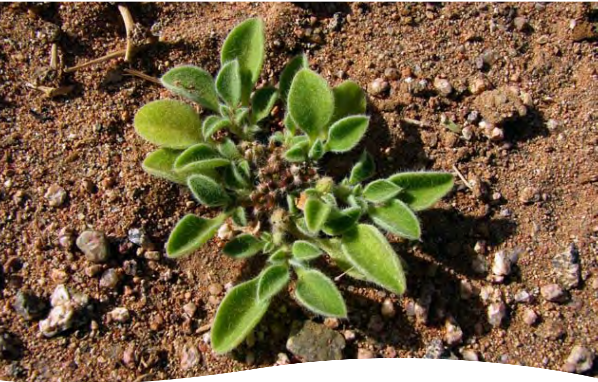
Aizoon canariense L. ■