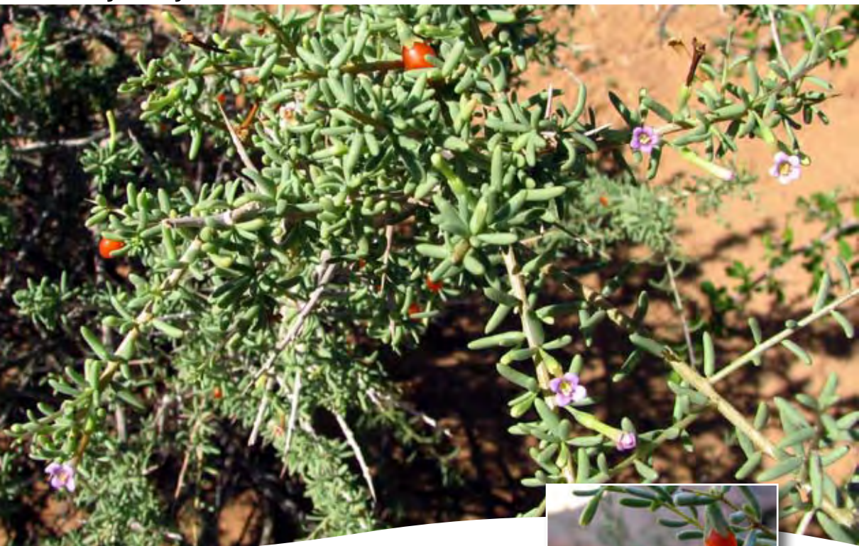
Lycium intricatum Boiss. ■