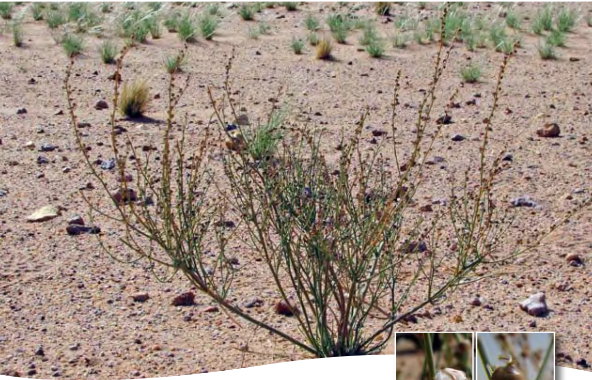
Asphodelus tenuifolius Cav. ■