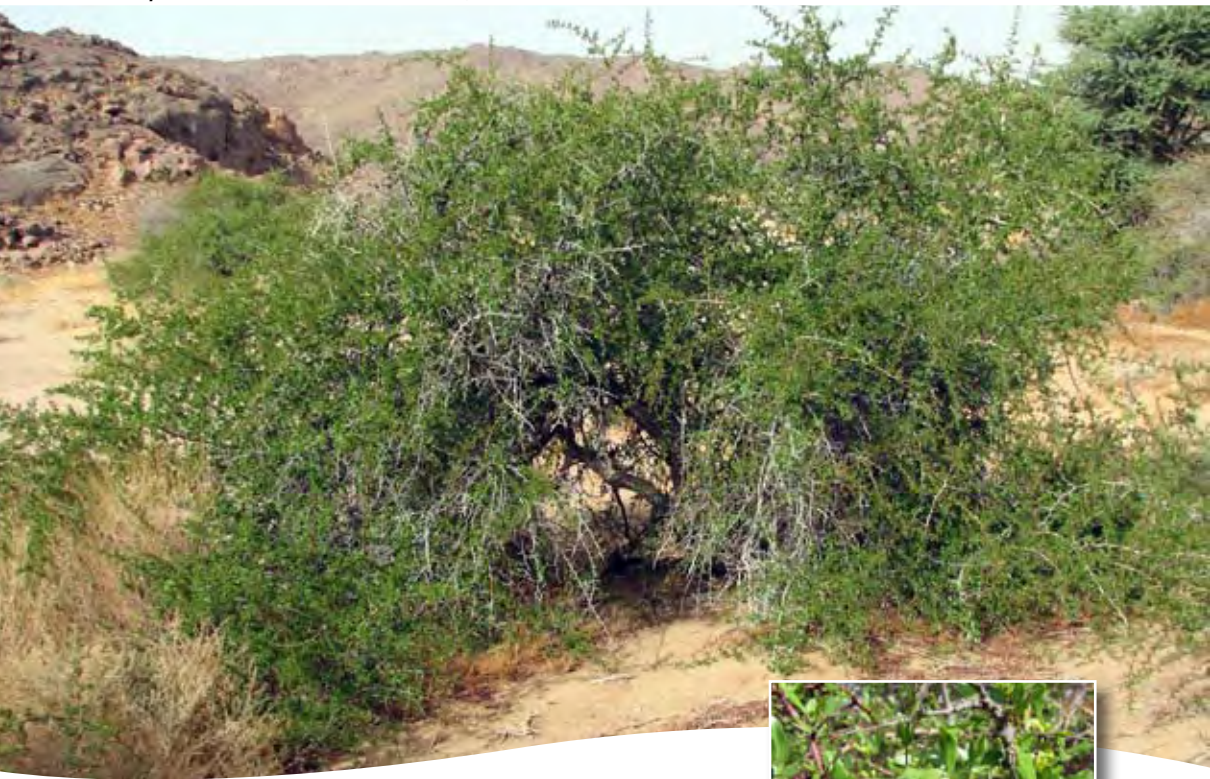
Rhus tripartita (Ucria) Grande ■ (= Rh. oxyacantha auct.)