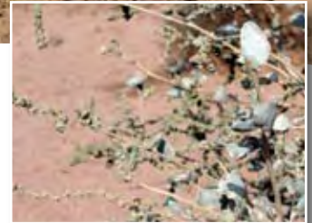
Atriplex halimus L. ■