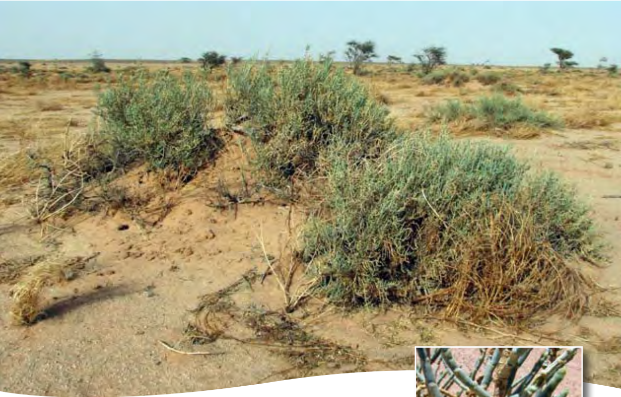
Anabasis articulata (Forssk.) Moq. ■