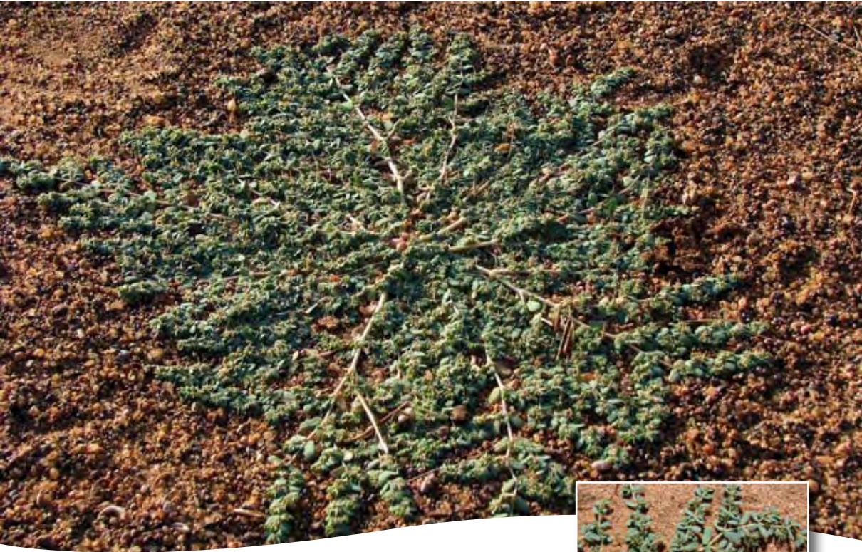
Euphorbia granulata Forssk. ■