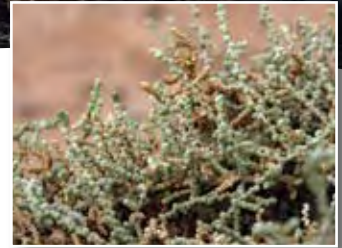
Salsola imbricata Forssk. ■ (= S. foetida Del.)