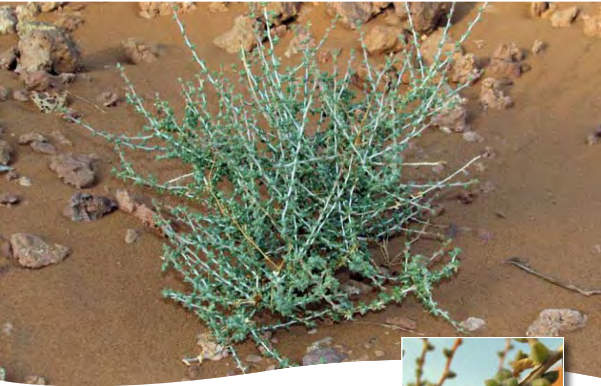
Traganum nudatum Del. ■