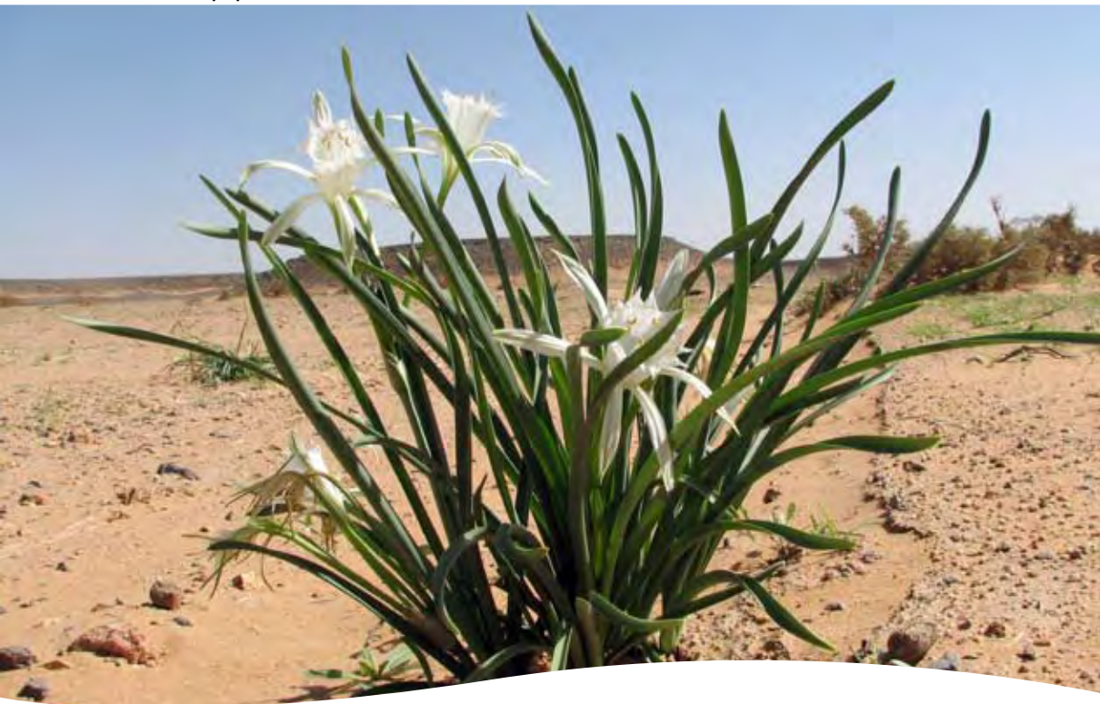
Pancratium trianthum Herb. ■