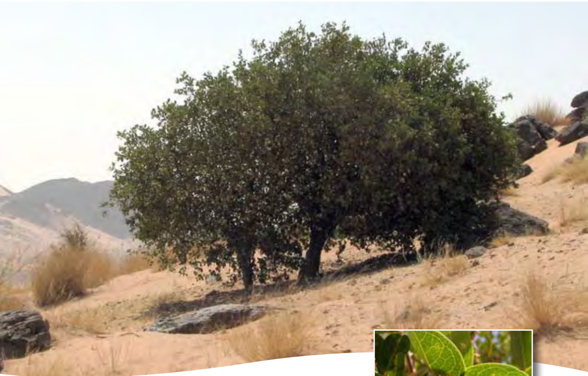
Boscia senegalensis (Pers.) Lam. ex Pour. ■