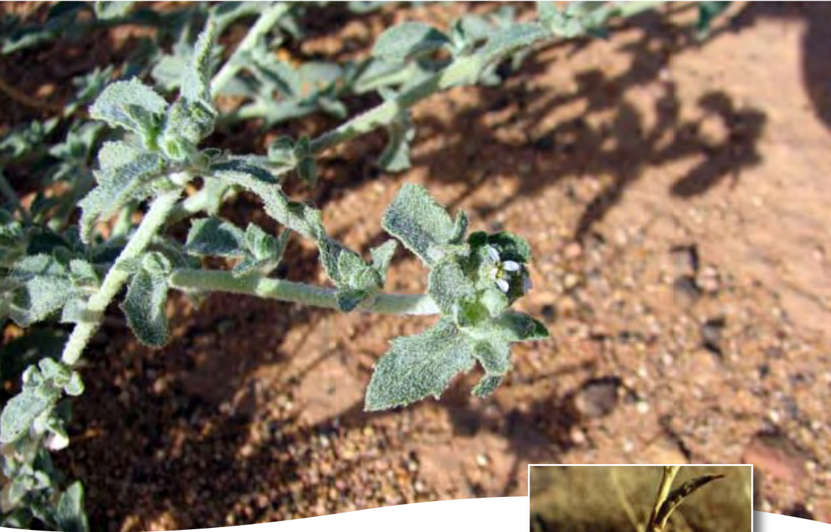
Morettia canescens Boiss. ■