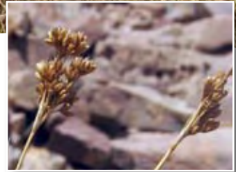
Juncus rigidus Desf. ■ (= J. maritimus auct. non Lam.)