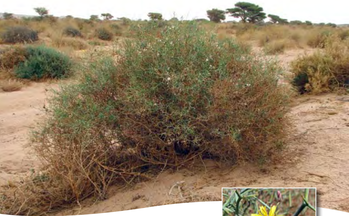
Launea arborescens (Batt.) Maire ■