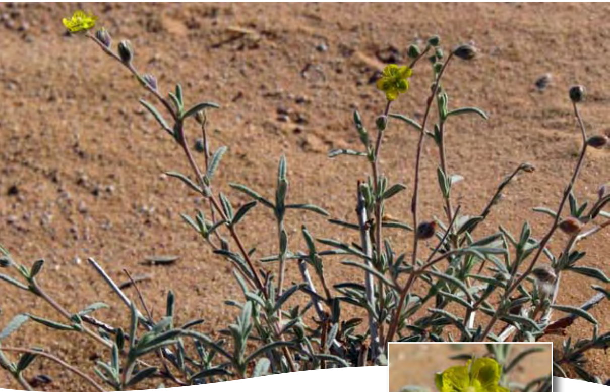
Helianthemum lippii. (L.) Pers ■