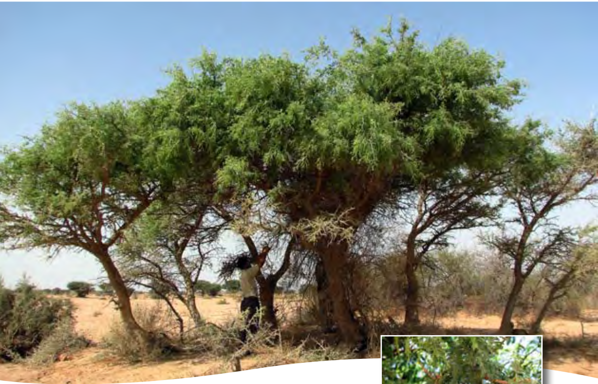
Faidherbia albida (Del.) A. Rich. ■ (= Acacia albida Del.)